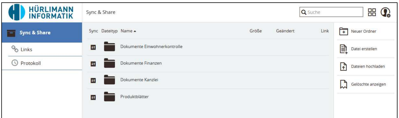
Oberfläche der HI Box (Internetbrowser)

Es ist ersichtlich wer welches Dokument zuletzt bearbeitet hat. Zusätzlich werden sämtliche Versionen gespeichert und können ganz einfach wiederhergestellt werden.