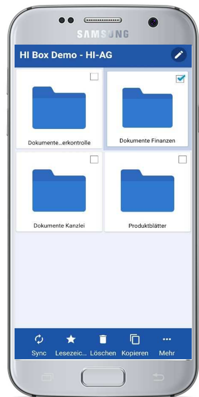
Oberfläche HI Box Android